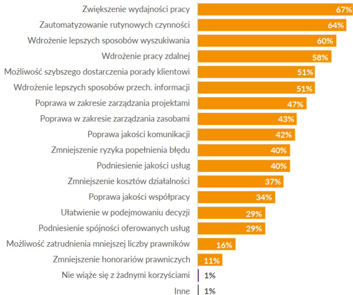
Wykres 8. Korzyści, które można osiągnąć dzięki wykorzystaniu systemów/narzędzi informatycznych na potrzeby świadczenia usług prawniczych z perspektywy badanych, n=140